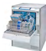
MELatherm 10 Evolution