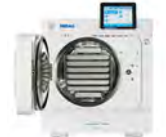
Vacuklav 43B+ Evolution