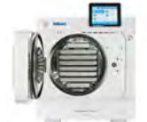
Vacuklav 41B+ Evolution