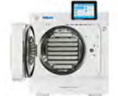
Vacuklav 44B+ Evolution