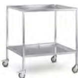
Instrumenten- und Allzwecktische